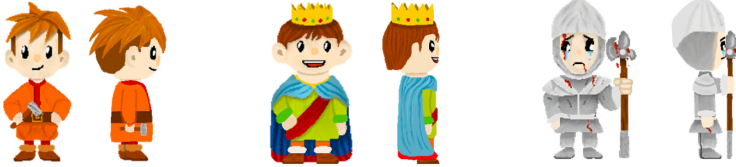
NPC's – personagens da Rota do Românico